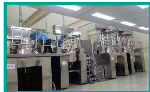
Внутреннее обустройство производства