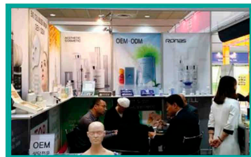
корнер на выставке